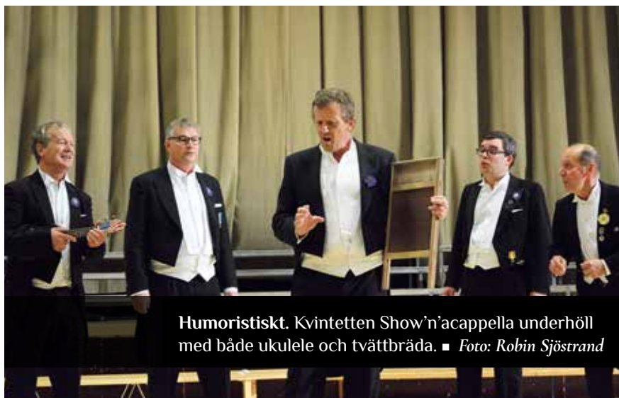
Humoristiskt. Kvintetten Show'n'acappella underhöll med både ukulele och tvättbräda.

veselija glas”, som alla de fyra köerna sjunger varsin gång.